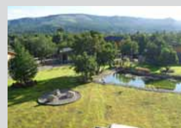
Cabañas Barrancas de Quilquihue.