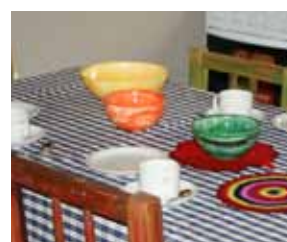
Barrancas de Quilquihue, se encuentra ubicada en Lolog, loteo Quilquihue, manzana 26 lote 13